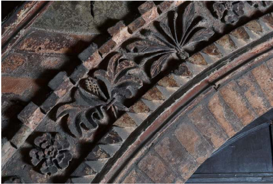
Particolare dei rilievi in cotto con motivi vegetali.