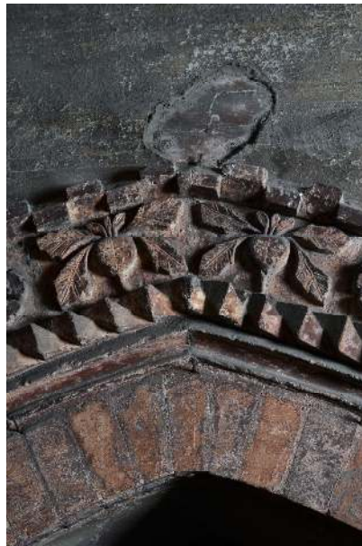
Particolare della cornice che delimita la lunetta unico elemento affrescato.

Per fotografare i particolari e far risaltare al meglio i dettagli della superficie intonacata è stata impiegata una luce radente, ottenuta collocando il flash a ridosso della parete in modo che il fascio luminoso fosse praticamente parallelo alla superficie.