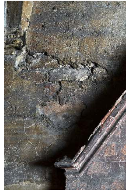
Particolare in cui si evidenzia una lacuna che lascia intravedere lo strato di supporto.