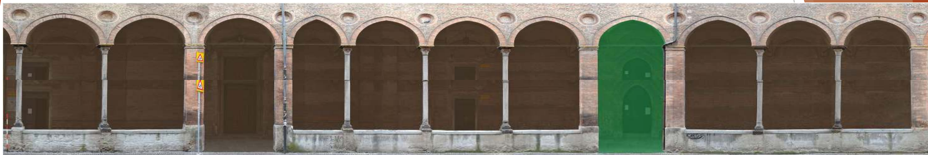
Visione panoramica frontale raddrizzata del porticato esterno della chiesa.