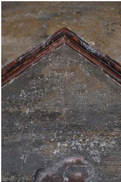
Particolare della modanatura in rilievo presente all'apice del portale.